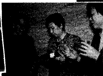
“AKIHIKOの弟”の役割はそろそろ……